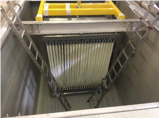
Membrane im Filterbecken