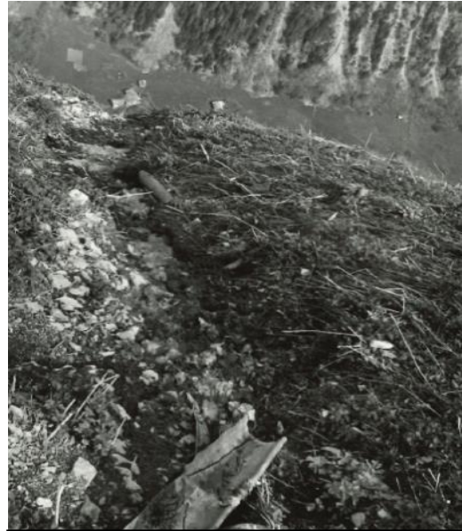
Ableitung von Abwasser über die Mürrenfluh, 1957