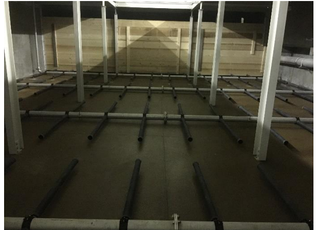
Rohrlüftung in Biologie