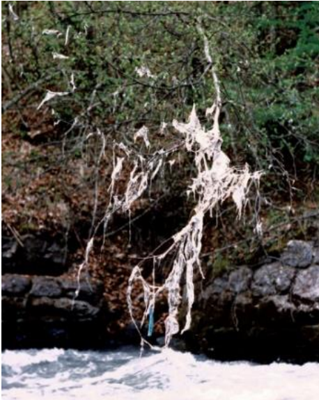
Verunreinigungen durch Abwasser in der Lütchine vor Inbetrieb- nahme der ARA 1988